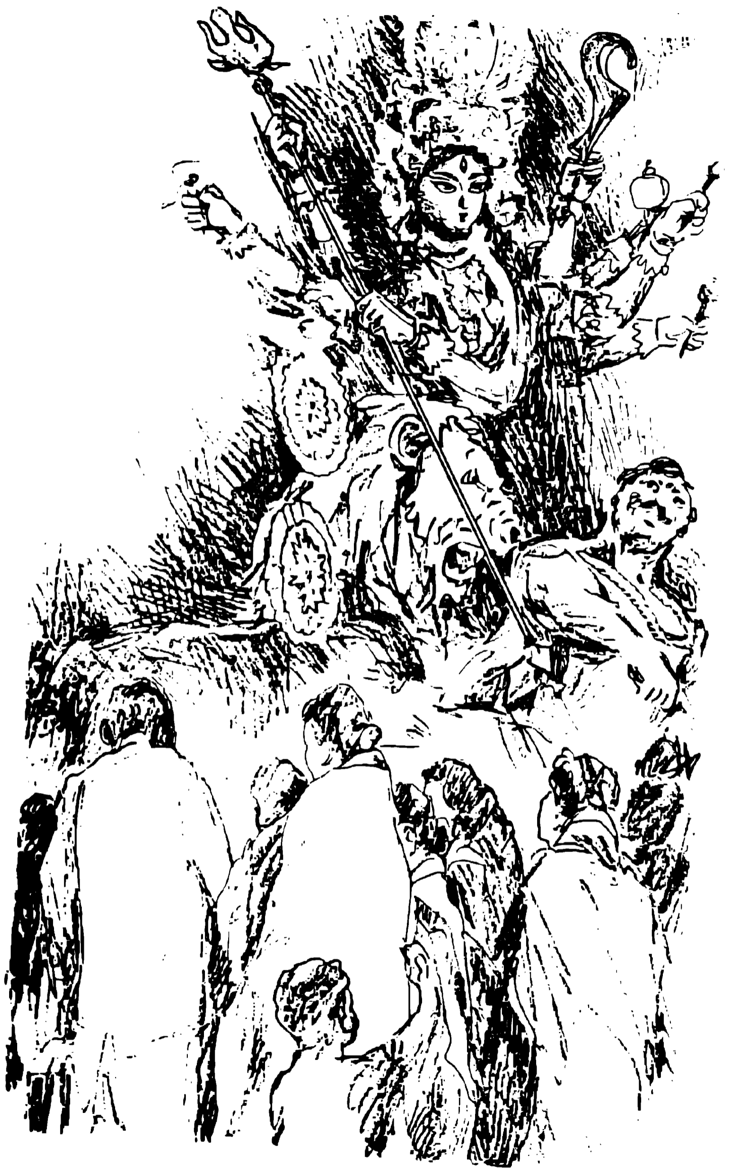
चित्र : दुर्गा की प्रतिमा